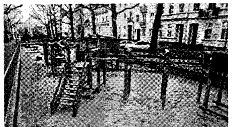
Die Holzgeräte des Spielplatzes sollen durch Kombinationen von Spielgeräten aus Metall ersetzt werden.

(RP) In der zweiten Hälfte dieses Jahres sollen die Aufträge für die Sanierung des Spielplatzes auf dem Westwall zwischen Nordwall und Liebfrauenkirche vergeben werden. Der Spielplatz wird intensiv genutzt, insbesondere in den Nachmittagsstunden von den Mädchen und Jungen der benachbarten Kindertagesstätte. Er liegt etwa einen Meter tiefer als das umgebende Areal und ist in einen Kleinkinder-, einen Tischtennis- und einen Gerätespielbereich eingeteilt. Während der Spielbereich gut angenommen wird, fehlen Rückzugsmöglichkeiten, um sich in Ruhe beschäftigen zu könne. Für Kinder über zwölf Jahren fehlt ein Spielangebot.